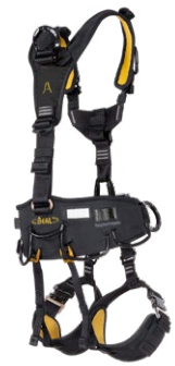
Solace S : BHP50.1 Solace M-L : BHP50.2 Solace XL : BHP50.3