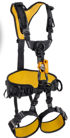
Solace Hold up S : BHP500.1 Solace Hold up M-L : BHP500.2 Solace Hold up XL : BHP500.3